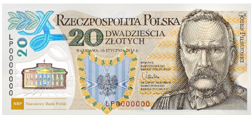
Rycina 16. Wizerunek banknotu 20 zł

Na stronie przedniej banknotu umieszczono wizerunek Marszałka Józefa Piłsudskiego, Orła w koronie raz Pałac Belwederski.