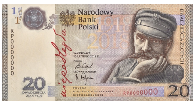
Rycina 17. Wizerunek banknotu 20 zł

Na przedniej stronie banknotu zamieszczony jest wizerunek Józefa Piłsudskiego, odznaka pamiątkowa 1 Brygady Legionów, napis „niepodległa” odwzorowany z rękopisu Józefa Piłsudskiego. Jest on zarazem logotypem programu obchodów 100-lecia niepodległości Polski.