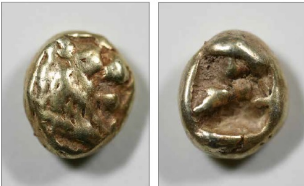
Hemiheka na ekspozycji NBP.

HEMIHEKTA jest jedną z najstarszych i pierwszych monet na świecie. Moneta została wybita między 650 a 651 r. p. n. e na terenie starożytnej krainy Lidii. Jest monetą niewielką wykonaną z elektronu czyli naturalnego stopu złota i srebra, o dużej sile nabywczej. W odróżnieniu od środków płatniczych tamtych czasów miała wybity symbol władzy królewskiej głową lwa.