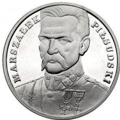
Rycina 2. Józef Piłsudski (1988)