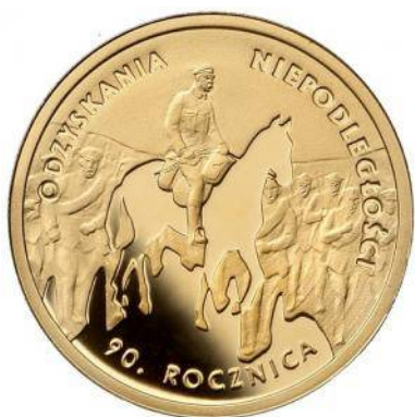
200 zł Au (2008)