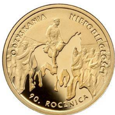
50 zł Au (2008)