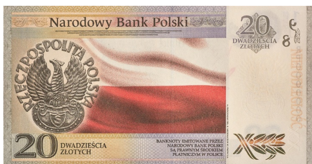
Rycina 17. Wizerunek banknotu 20 zł

Dnia 7 listopada 2018 r. NBP wprowadził do obiegu unikalne monety w kształcie KULI z napisem „100. rocznica odzyskania przez Polskę niepodległości”: