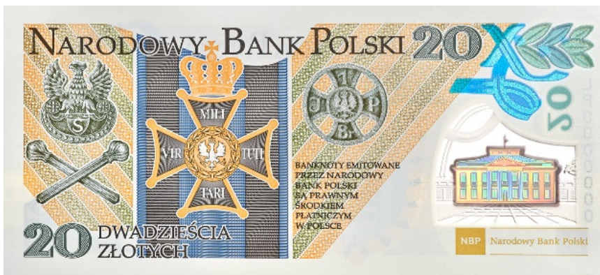
Rycina 16. Wizerunek banknotu 20 zł

Dnia 31 sierpnia 2018 r. NBP wprowadził do obiegu banknot NIEPODLEGŁOŚĆ – STULECIE ODZYSKANIA NIEPODLEGŁOŚCI, O NOMONALE 20 ZŁ.