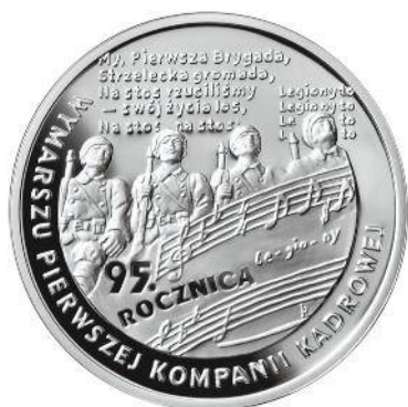
10 zł Ag (2009)