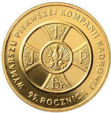
2 zł CuAl5Zn5Sn1 (2009)