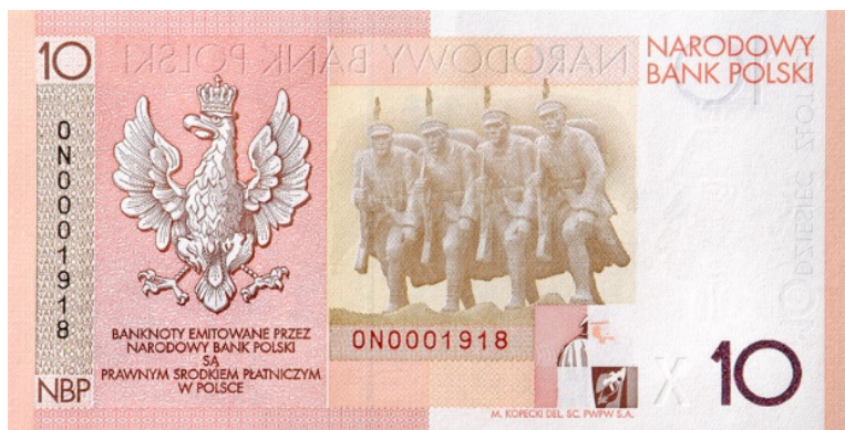
Rycina 15. Wizerunek banknotu 10 zł

W 100. rocznicę utworzenia Legionów Polskich NBP wyemitował banknot kolekcjonerski o nominale 20 zł.