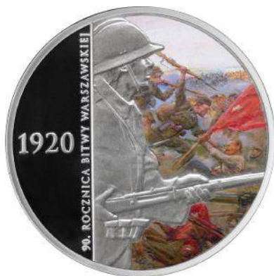
20 zł Ag (2010)