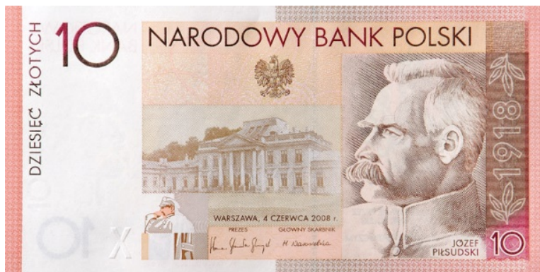
Rycina 15. Wizerunek banknotu 10 zł

Głównymi elementami graficznymi strony przedniej jest popiersie Józefa Piłsudskiego oglądane z profilu oraz widok Pałacu Belwederskiego – siedziby Naczelnika Państwa w latach 1918-1922, a od 1926 r. do 1935 r. rezydencji Marszałka.