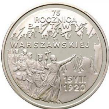
Rycina 6. 75. Rocznica Bitwy Warszawskiej