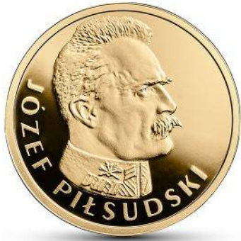
100 zł Au (2015)

Rycina 14. Stulecie odzyskania przez Polskę niepodległości – Józef Piłsudski