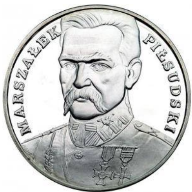
Rycina 3. Józef Piłsudski (1990)